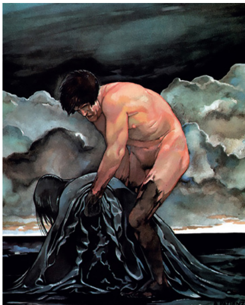
Amore mio, da from «Frigidaire» n.12, 1981