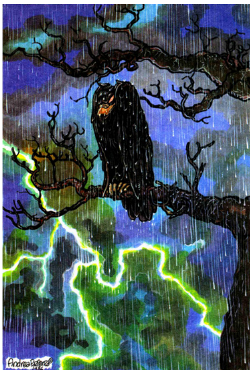
Illustrazione per Illustration for Agenda verde, 1987