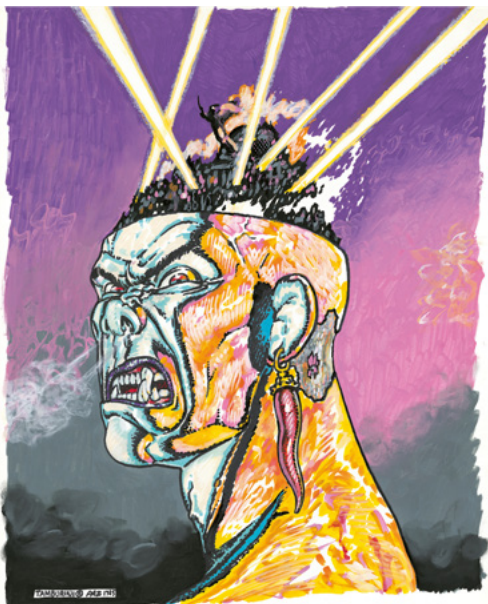
Disegno di copertina per Cover illustration for «Frigidaire» n. 60/61, 1985