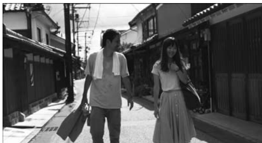
A Midsummer's Fantasia