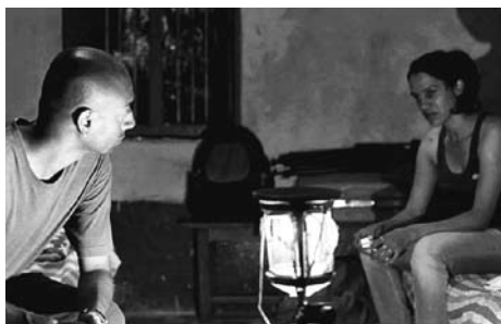
Fig Fruit and the Wasps