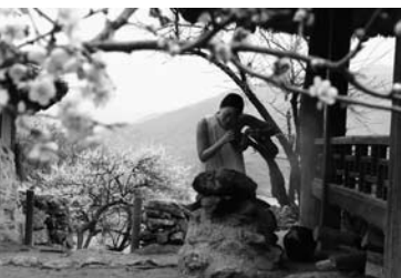
Ode on a Korean Urn