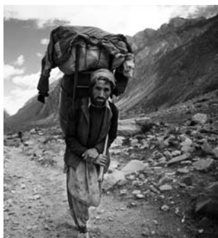
K2 and the Invisible Footman