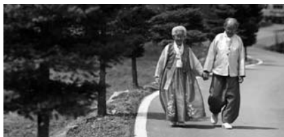
My Love, don't cross that River