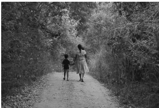
Silence in Courts