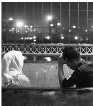
A Question for my Father