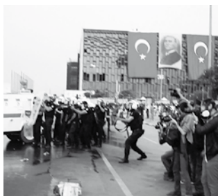
Love will change the Earth