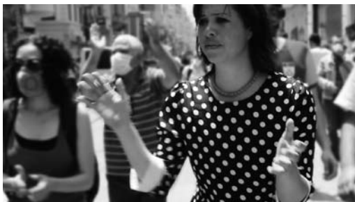
One Million Steps